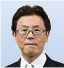
五島長崎国際トライアスロン大会実行委員会 会長(五島市長)