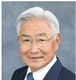
公益社団法人 トライアスロンジャパン 会長

<Note>*Renamed from the Japan Triathlon Union (JTU) as of July 1, 2025